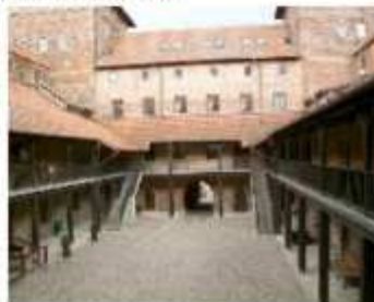
Nidzica widok na dziedzińiec zamku. Tu potykają się rycerze różnych bractw