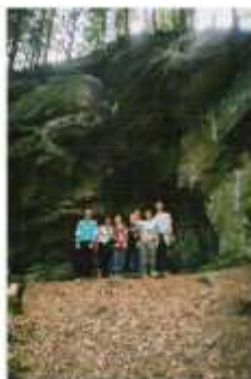
Jak dzieci sami zdobywać góry...