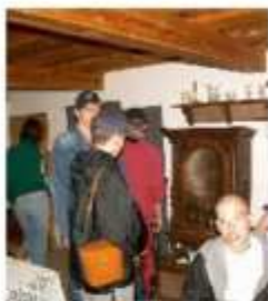
Podziwiamy wnętrze jednej z chat w skansenie w Olsztynku

Podczas zwiedzania najbardziej podobał mi się zamek krzyżacki, jak też przewodnik, który przedstawił historię zamku w Olsztynie. Spodobały mi się oglądane zbroje rycerskie, a w Olsztynku – konna straż pożarna i drewniane domy kryte strzechą. Mogłam zobaczyć, jak dawniej żyli ludzie. Byłam w planetarium. Chciałbym zachęcić inne osoby do zwiedzania opisanych miejsc. Marzę o zwiedzeniu innych ciekawych zakątków. Wycieczka była długa i męcząca, do szkoły wróciliśmy wieczorem.