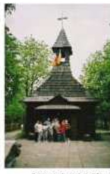
Opoczyńska przysiężnica na Stecówce