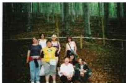
Wizyta w Niezgodziankach – spacer po Leśnym Parku Niezgodzianek