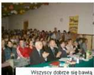
Wszyscy dobrze się bawią