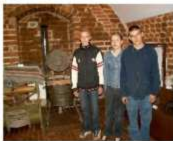
Uczniowie na tle ekspozycji muzealnych na zamku krzyżackim w Nidzicy