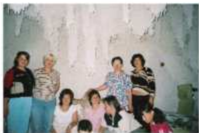
Za opieką bieżącą rehabilitacji górnej drogi oddechowej w grotach solnych