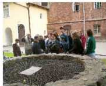
Na dziedzińcu zamku w Olsztynie