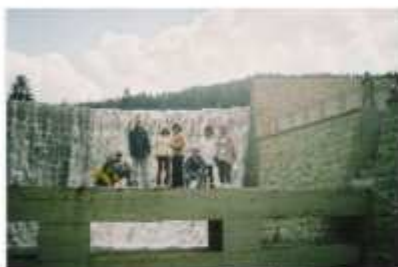
Skała w Czernylu