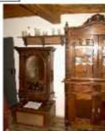
Skansen w Olsztynku tak wyglądały kiedyś meble