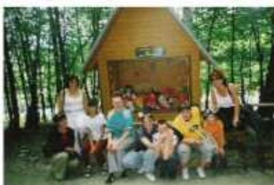
Wizyta w Rajowym Świątku